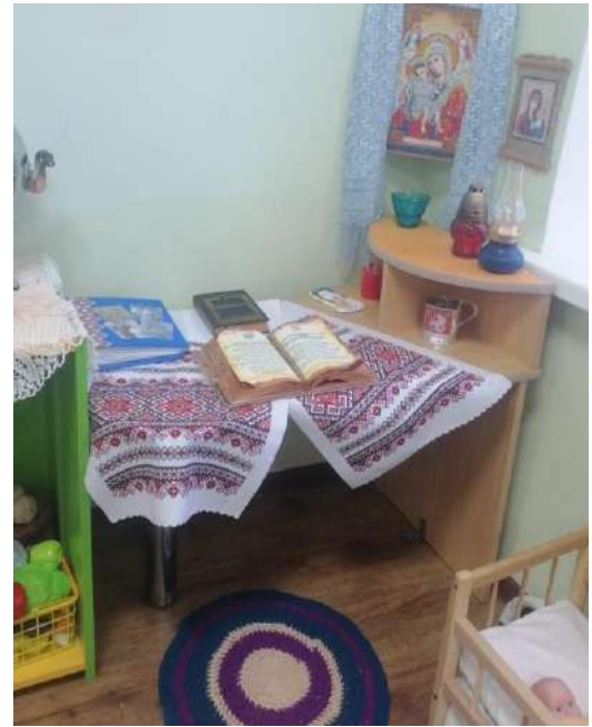
Мебель состоит из мобильных ящиков